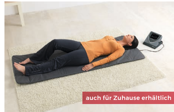
auch für Zuhause erhältlich