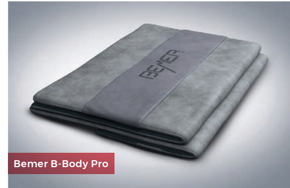
Bemer B-Body Pro