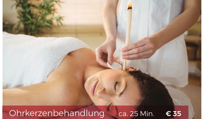
Ohrkerzenbehandlung ca. 25 Min. € 35

Haarentfernung mit Heißwachs € 12 Oberlippe € 14 Kinn € 14 Nase | Ohren € 16 Augenbrauen € 24 Wangen € 40 Gesicht: Wangen, Oberlippe und Kinn € 40