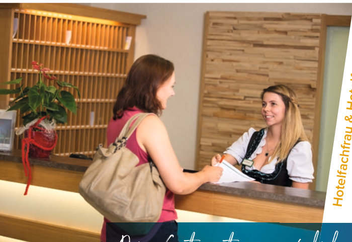
Hotelfachfrau & Hotelfachmann