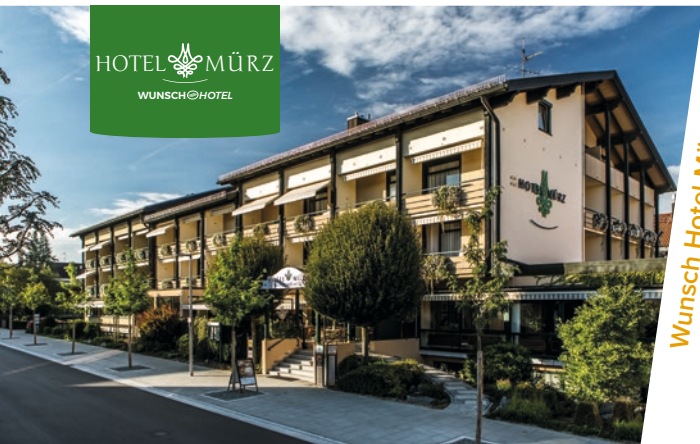
Wunsch Hotel Mürz

"Ihr familiengeführtes Natural Health & Spa Hotel"