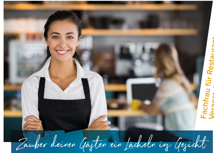
Fachfrau für Restaurants und Veranstaltungsgastronomie

Zauber deinen Gästen ein Lächeln ins Gesicht