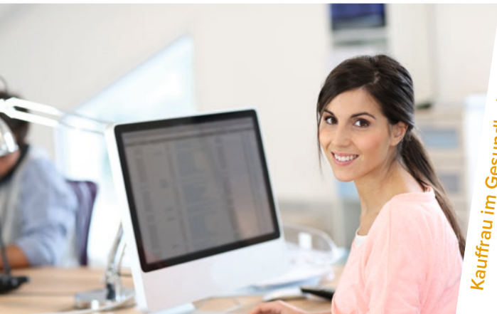
Kauffrau im Gesundheitswesen