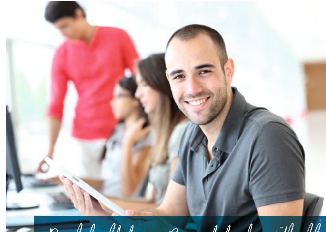
Kaufmann für Büromanagement