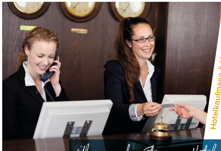
Hotelkaufmann & Hotelkauffrau