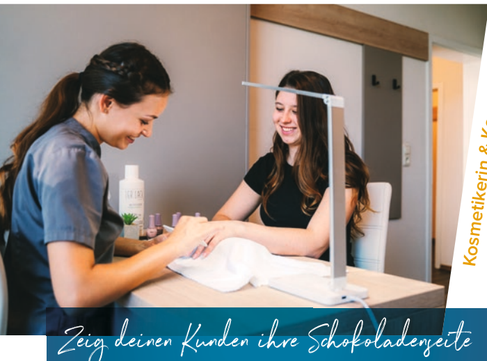
Kosmetikerin & Kosmetiker